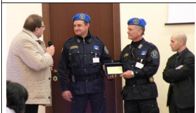
la targa assegnata dal CUN ai rappresentanti della Protezione Civile del Lazio;