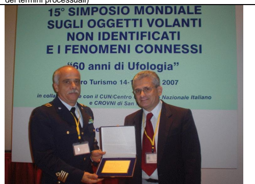
la targa del CUN al Reparto Generale Sicurezza della A.M. italiana, 15 aprile 2007

Si fotografano gli esponenti del Cun con i Militari ( http://www.cun-italia.net/ ), si fanno interrogazioni parlamentari con i deputati di questo o quello schieramento politico, si collabora con la Protezione Civile: insomma gli Italiani sarebbero in buone mani. Nemmeno il CNR sarebbe in grado di fare meglio nello studiare il fenomeno ufologico