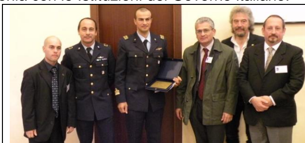
i rappresentanti del Reparto Generale Sicurezza, Stato Maggiore Aeronautica con alcuni esponenti del CUN

Nei convegni del Cun inoltre si tende sempre a donare l'immagine di un Centro in perfetta armonia con le Istituzioni del Governo italiano.